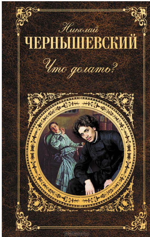
«Что делать?» Н. Чернышевский